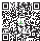
幼儿教师资格考试真题

针对幼儿教师资格证考试和招教考试，本教材设置了“课堂互动”和“在线测试”板块，精选题目让学生练习，同时放置有“幼儿教师资格考试真题”供学生学习，为学生以后顺利考证助力。