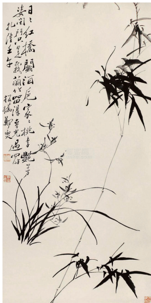
图1 郑板桥画的《竹子》