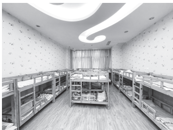
图 1-3 干净整洁的午睡室

托幼园所的建筑和设备卫生条件，可以为幼儿的身心发育和健康成长提供可靠的物质保障，如图1-3、图1-4所示。良好的社会心理环境可以为幼儿营造相互尊重、彼此平等的人际氛围，激发幼儿探索和学习兴趣，促进幼儿的认知发展和心理健康。