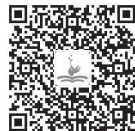
学前儿童健康标准

对于正处在成长阶段的学龄前幼儿的健康状况该如何进行评判呢？考虑到幼儿的年龄特点，在认识和运用“健康”这一概念时必须注意以下几点。