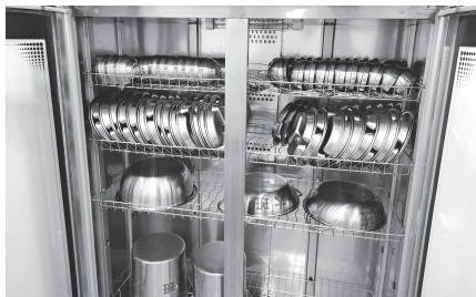
图 1-4 幼儿园消毒柜