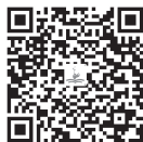
幼儿园教师资格考试真题