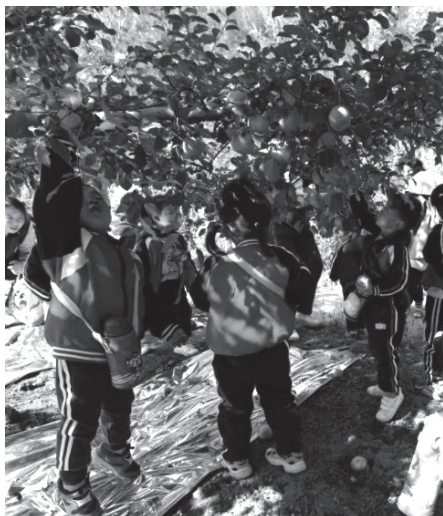
图 1-1 幼儿在自然环境中进行采摘活动

微系统对幼儿健康有直接作用，主要包括幼儿的父母和其他家庭成员、同伴。家庭成员的年龄、职业、文化程度、个性特征和个人卫生习惯等属性会对子女健康产生影响；家庭成员的构成和家庭关系，如单亲家庭、父母关系等也会对子女的健康产生影响。此外，家长的教养方式，如父母的养育态度和行为、亲子互动和隔代教养等也可能对幼儿健康产生重要影响。