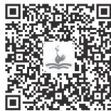
拓展：幼儿文学的分类

幼儿喜欢听儿歌、童话，看图画故事。幼儿文学能让幼儿身心愉悦、了解社会、认识自然、陶冶性情品格、发展思维能力，是幼儿最早接触的文学样式，对幼儿的精神成长具有深远影响。