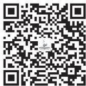
节气诗词在幼儿园的运用

当然，传统文化的传承不是单纯地教幼儿诵读《三字经》《弟子规》等古代典籍，而是要遵循幼儿教育的规律，选取传统文化中的精华对幼儿进行适宜的教育。可供幼儿阅读的优秀传统文化读物很多，如一些传统文化故事图画书、经典诗文等。