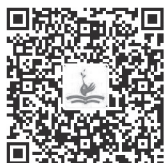
幼儿文学的基本理论

我们习惯上所说的“幼儿文学”，其接受对象也包括0～1岁的婴儿，从严格意义上说，是婴幼儿文学的总称。另外，也有些地方把它称作“低幼文学”和“学前儿童文学”。