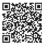
■ 幼儿行为观察的整体观案例参考

阅读所收集的幼儿行为观察案例，分析其中所体现的幼儿发展的整体观（也可参考右侧二维码中的案例），并填入以下的方框内。