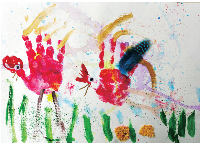
严冠杰《大公鸡喔喔叫》

这首儿歌让幼儿了解到多种动物尾巴的特点，而儿歌采用提问的形式，有利于促使幼儿积极思考，激发他们的求知欲。