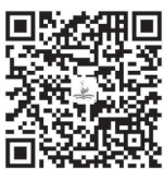
感动中国人物——张桂梅

大千世界,纷繁复杂;文化经典,灿若星河。然而,那些最深沉、最恒久的道理,也往往最简单、最朴素。